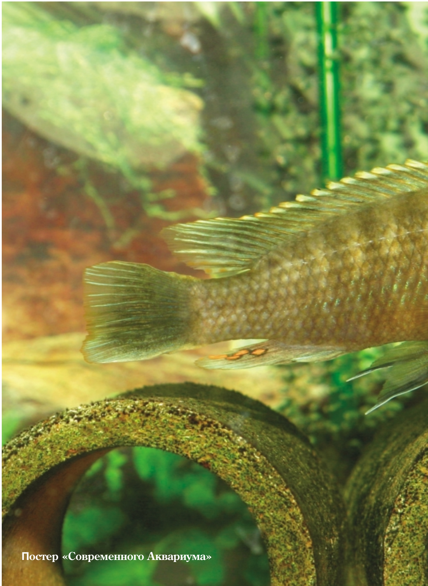
Постер «Современного Аквариума»