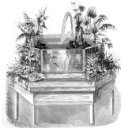
Вот так выглядел декоративный аквариум во времена Н.Ф. Золотницкого

Во второй половине двадцатого века, преимущественно в Германии, проводились неоднократные попытки развить идею декоративной оранжереи, совмещенной с аквариумом. Результаты впечатляли, но все же это было не совсем то, что нужно. Проблемы были очевидны и вызывались опять-таки отсутствием или труднодоступностью многих конструкционных материалов и необходимых источников освещения. Запотевание смотровых стекол, сложности с освещением аква-