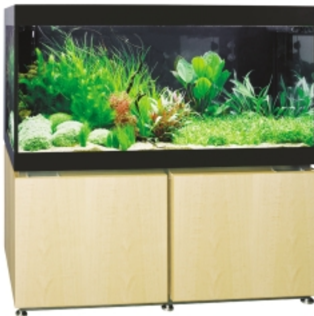
рис. 4. Аквариум «Edition W1» — единственный, комплектующийся лампами стандарта T5