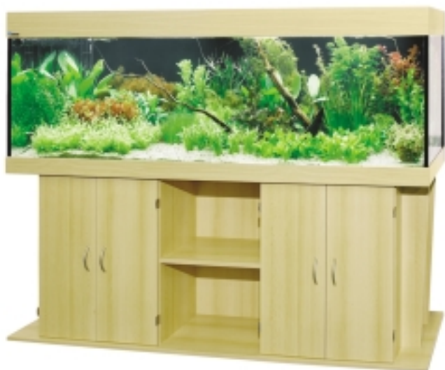
рис. 3. Аквариумы серии «КАРАТ» выполнены из очень прочного 12-миллиметрового стекла и снабжены надежной, красивой и удобной тумбой с выдвижным поддоном для канистрового биофильтра