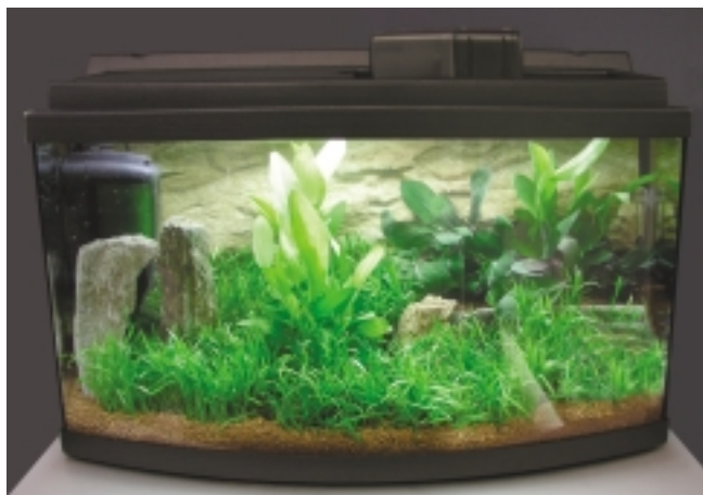
рис. 1. Самая маленькая из моделей новой линейки аквариумов «MP» — это емкость размером 60×35×40 сантиметров с популярным сегодня выгнутым лобовым стеклом. По сути, это набор для начинающего аквариумиста, в комплект которого входят также нагреватель и внутренний фильтр «ЕНЕИМ»